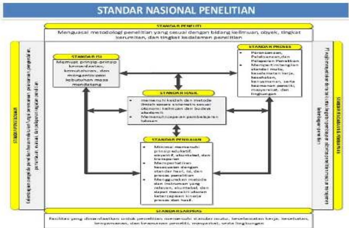
Gambar I.1 : Standar Nasional Penelitian

Adapun tujuan penyusunan standar Penelitian adalah :