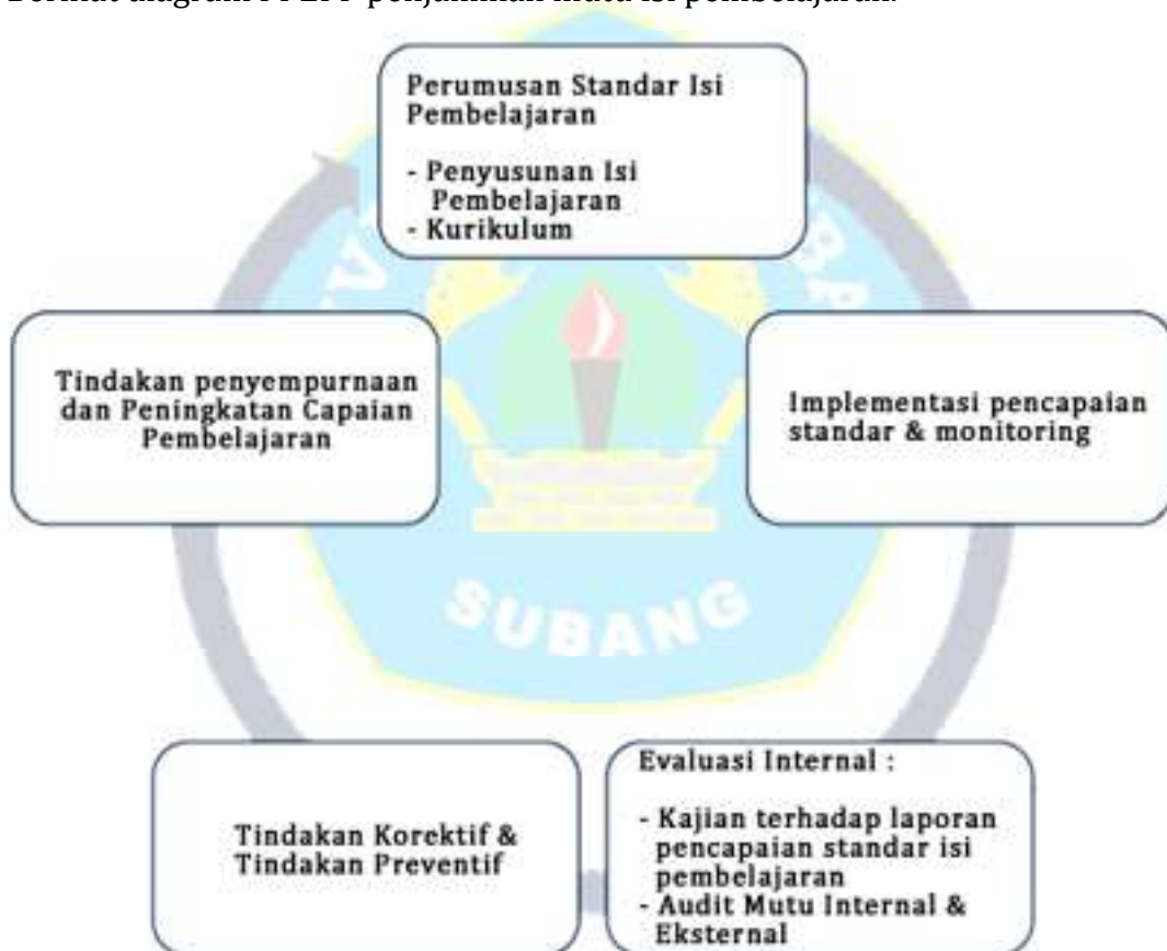
Gambar IV.1 : Diagram PPEPP Penjaminan Mutu Isi Pembelajaran

Berikut diagram PPEPP penjaminan mutu Isi pembelajaran.